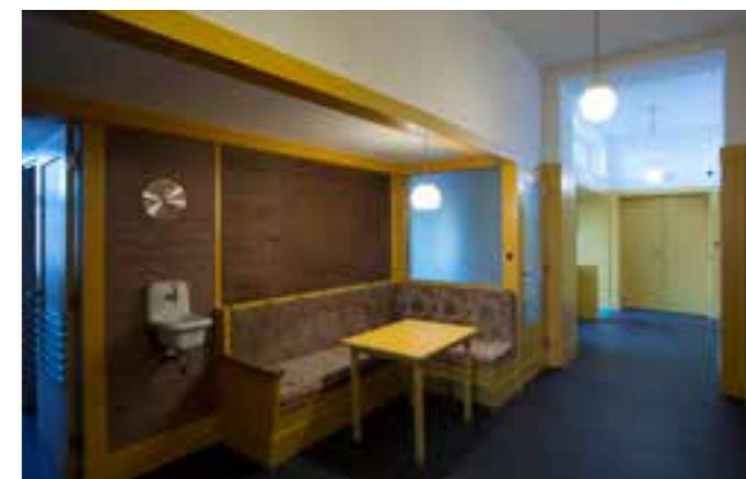
Soukromé patro rodiny po rekonstrukci