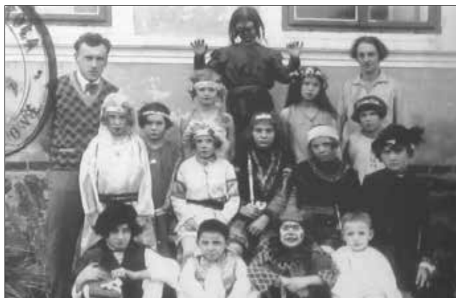
Maškarní ples v Úsilově, 1929

vznikly školy dvojjazyčné. Česky se v nich ve většině případů začalo učit až po 2. světové válce. Jaký je osud školních budov na Tachovsku dnes?