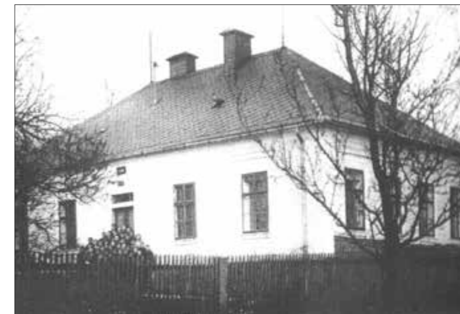
Škola v Rájově byla zavřena v roce 1946

Příští díl se bude týkat zaniklých škol na Rokycansku.