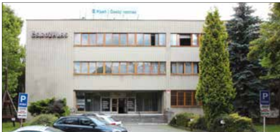
Budova ČRo Plzeň je kulturní památkou

V roce 2006. Já jsem tehdy končil v Radiu Kiss Proton, později jen Kiss Radiu. Byl jsem vyzván, abych se zúčastnil konkurzu na ředitele plzeň-