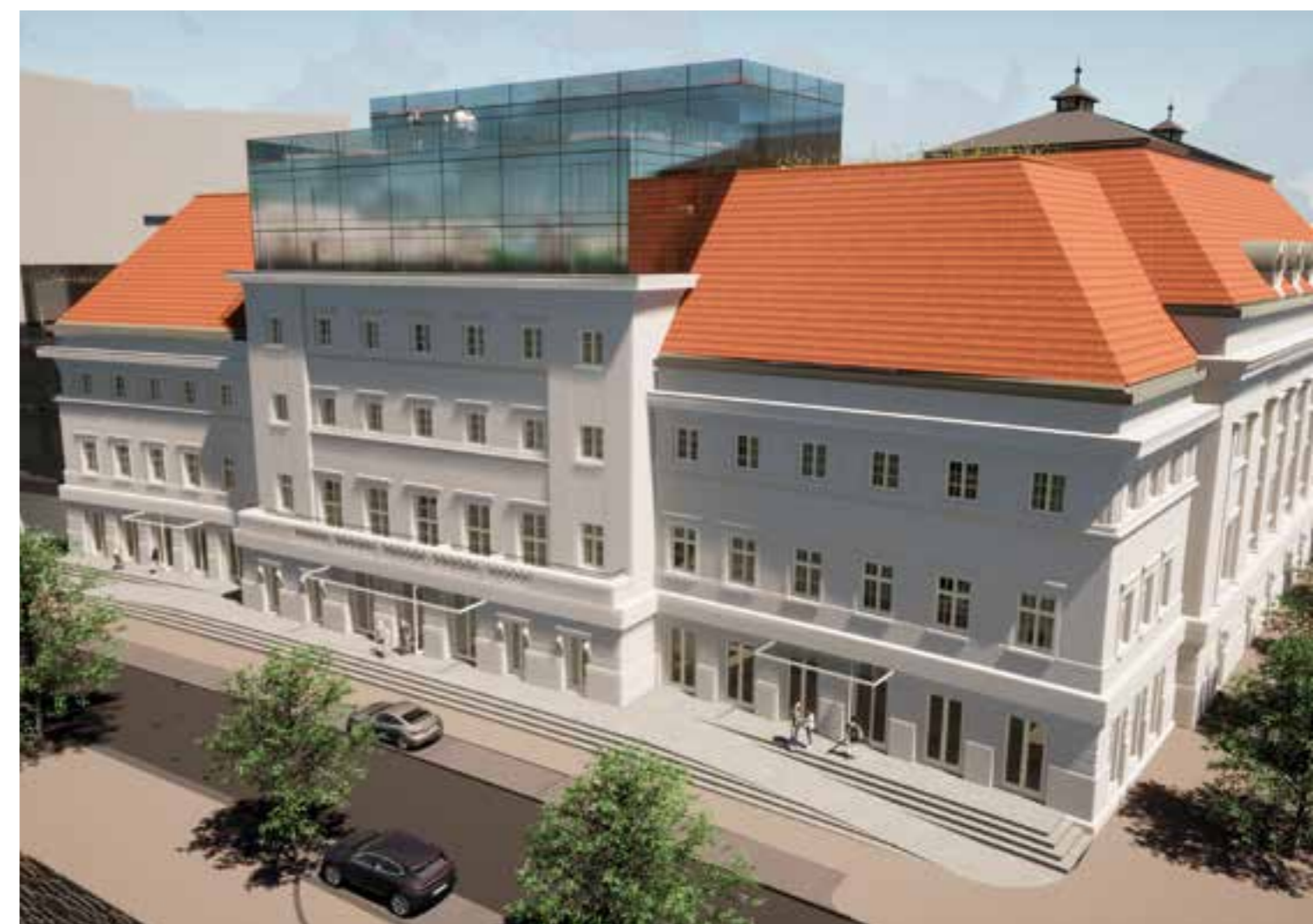
Vizualizace nového vzhledu budovy Městských lázní.

Zdroj: wikipedia.cz, pam.plzne.cz, plzensky-kraj.cz