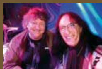
S Kenem Hensleym

Zahrál sis s nimi? Ano, ale nezahrál jsem si já s nimi, ale oni s námi. Když hráli na Bratislavské lyře, odskočili si pak inkognito na čtrnáct dnů do Karlových Varů do Puppů, kde jsme hráli. Po půl hodině hraní koukám, že vchází kompletní Smokie včetně Chrise Normana. Sedli si pod pódiem, pozdravili nás, ale za chvíli vidím, že jim barman něco vysvětluje, oni se zvedli a odešli. Udělal jsem pauzu a ptám se barmana, co se děje, a on odpověděl: „Mají džiny a já se kvůli nim nenechám vyhodit z práce. I kdyby to byl Gott, tak mi sem v džínách nesmí.“ Za půl hodiny se vrátili Smokie převlečení a na závěr večera jsme si společně dali jam session. Zajamoval jsem si také se slavnými maďarskými P. Mobil. Zažil jsem hezké povídání s Kenem Hensleym z Uriah Heep, znám se se spoustou německých hvězd, u nás neznámých.