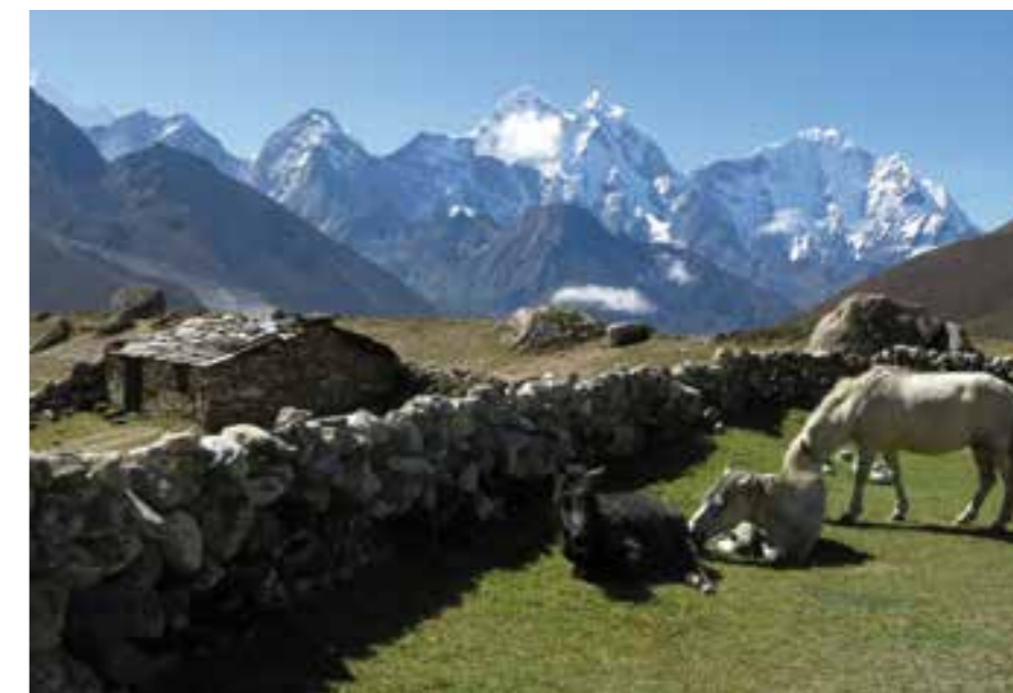
Trek pod Mt. Everest