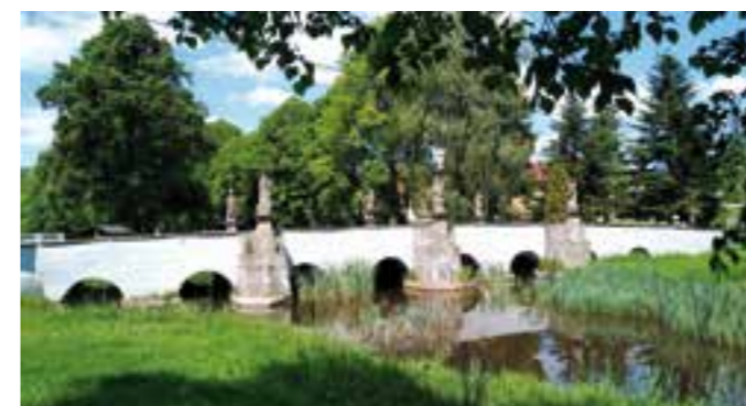
Barokní most přes řeku Radbuzu v Bělé nad Radbuzou