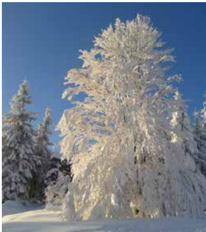
Zima na Špičáku

Čas ubíhá hodně rychle, jako keňský maratonec Eliud Kipchoge, který letos zaběhl 42 195 m v neuvěřitelném čase 2:01:09. A jsou tu zase Vánoce a Silvestr, zima. Končí hodně hektický rok 2022, kdy jsme se zbavili strachu z covidu a vrátili se naplno k normálnímu životu, ale kdy jsme se začali zase bát v našich končinách téměř zapomenutého slova válka. Někteří politici nás začali strašit i slovem chudoba, ale tak nějak zapomněli na fakt, že Česko patří k těm šťastnějším zemím na planetě, kde si žijeme nadprůměrně dobře. Navzdory inflaci a zdražování všeho kolem nás.