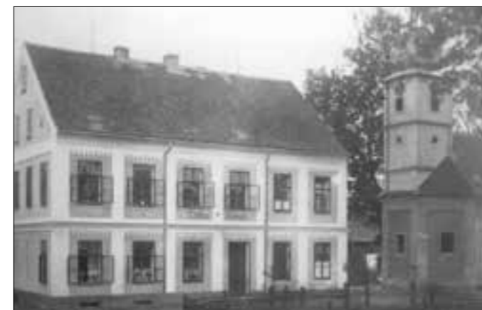
Zadní Chodov kdysi...

Některé školní budovy vzniklé na přelomu 19. a 20. století slouží dále občanům – jako společenské či kulturní sály, tělocvičny – nebo je využívají místní dobrovolní hasiči. Tento veselejší osud potkal budovy třeba v Broumově, Zadním Chodově, Chodském Újezdu, Sytně či v Myslince.