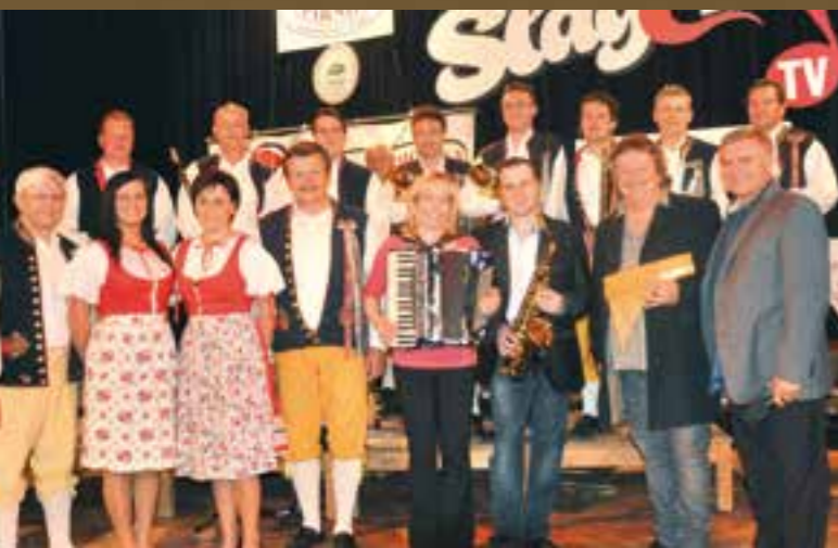
Natáčení pro Šlágr TV

Když jsi vystupoval pod Pragokonzertem, kolik si vzal za to, že vás pustili na Západ? Brali si 46 procent našich výdělků, valuty nám směnili na bony, měli jsme tuzexové konto. Ale od pana Karla Gotta nebo Sukova kvarteta Pragokonzert inkasoval rovných 80 procent jejich příjmů.