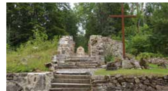
Pozůstatky kostela sv. Jiří v zaniklé obci Lučina u Nemanic