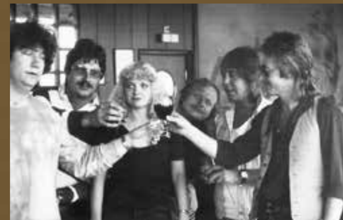
S kapelou Smokie

samozřejmě ponorka se někdy dostavila; to jedeš první měsíc a myslíš si, že vyděláš balík, druhý měsíc už si něco dopřeješ a třetí měsíc si říkáš, že se na to můžeš vykašlat, a jedeš si koupit lahev whisky.