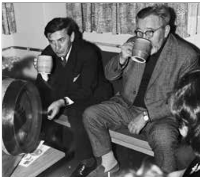
Filmové hvězdy na festivalu Finále – Jan Werich a Josef Abrhám