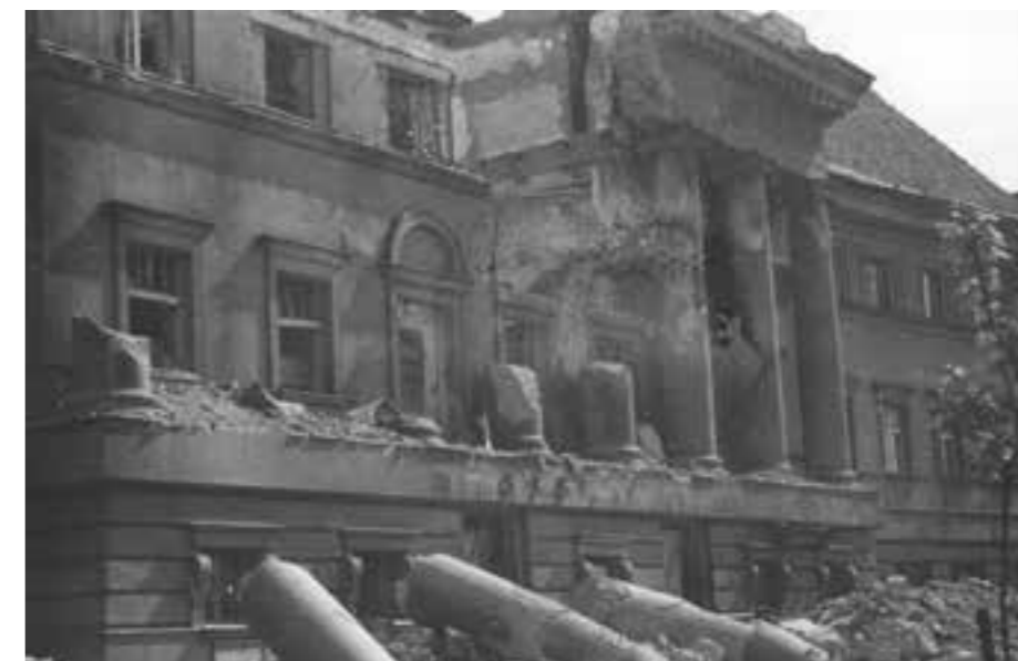
Po bombardování v roce 1944

„Máme teď jedinečnou příležitost do této budovy umístit expozice a depozitáře Západočeské galerie, multifunkční sál, konferenční sály a prostory pro talentované děti ze střediska Radovánek, environmentální centrum zaměřené na změnu klimatu