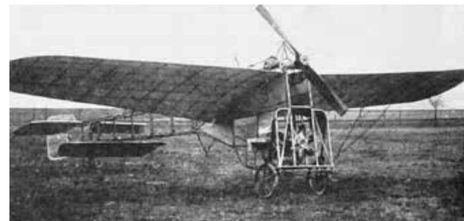
Celkový pohled na Očenášek 1 na letišti v Plzni na Borských polích

na francouzské, italské a ruské frontě. Azabýval se i špionáží, zřídil tajnou telefonní stanici, kde odposlouchával tajné vojenské linky nepřítele. Za to byl později vyznamenán a stal se přítelem prezidentů T. G. Masaryka i Edvarda Beneše, byl často zván na Pražský hrad.