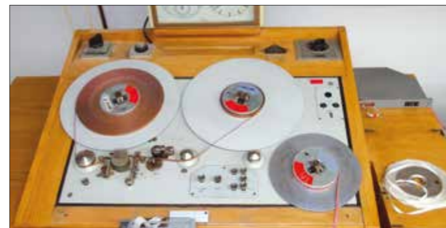
Cesta do pravěku: tento stříhací magnetofon najdete v rozhlasovém muzeu

Rozhlas se drží, ale televize se stává fenoménem. Číslo poslechovosti jsou dnes nižší než v roce 2000, ale výhodou rozhlasu je jeho schopnost absolutní aktuality. Navíc dnes již nabízíme online i možnost poslechnout si vybraný rozhovor v tzv. podcastu kdykoliv