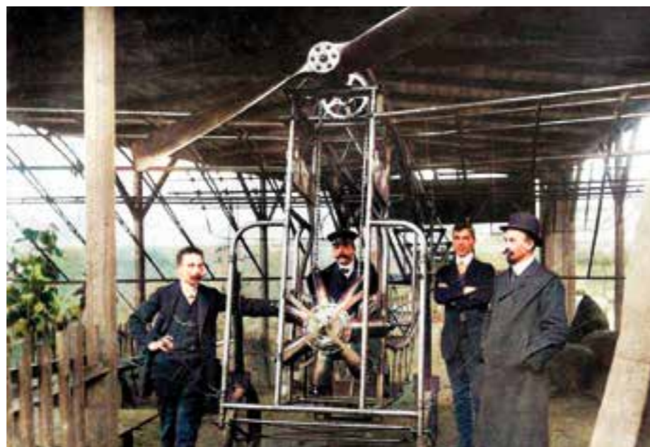
Se spolupracovníky před prototypem aeroplánu „Očenášek 1“