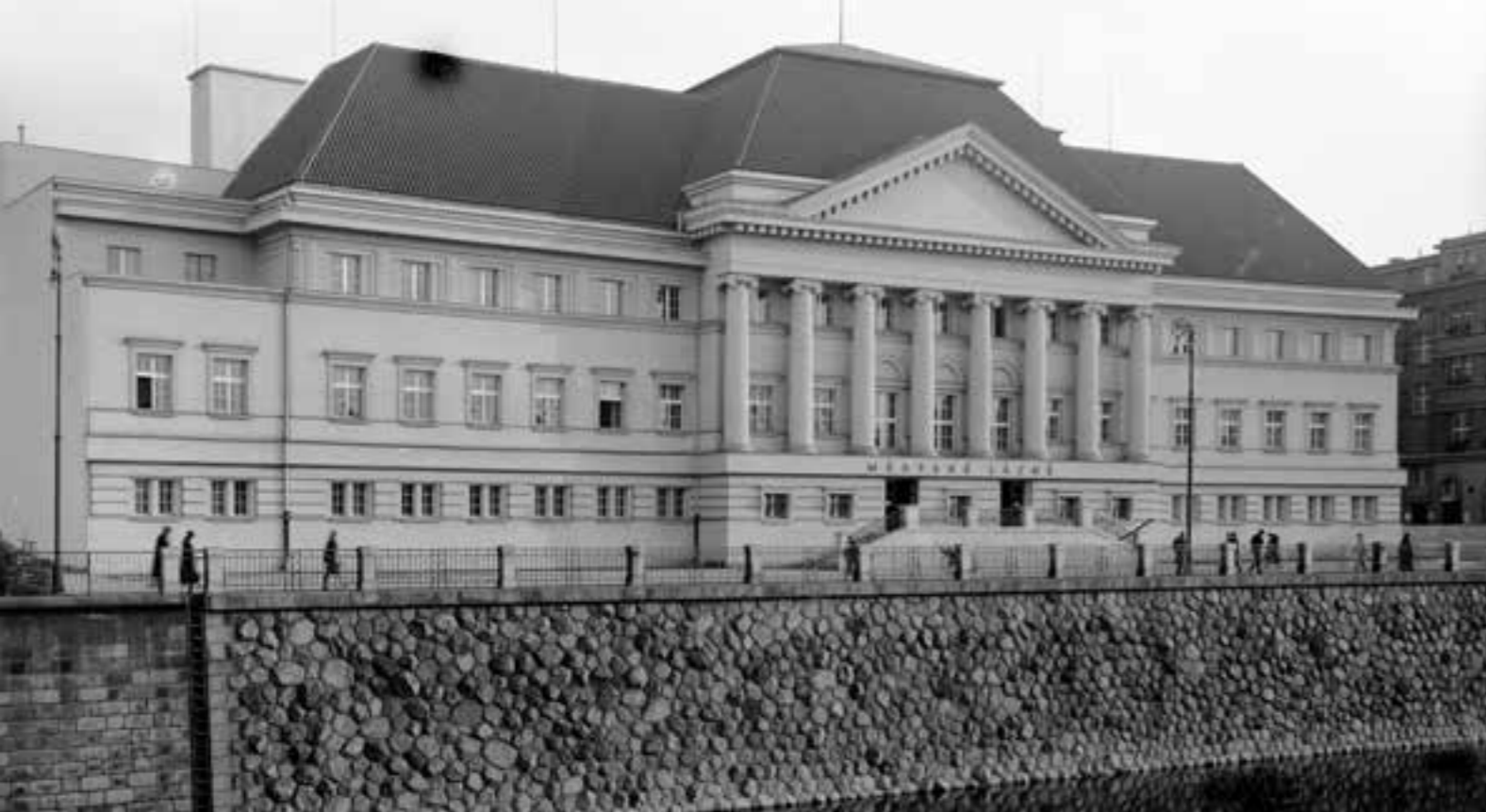
Městské lázně, Denisovo nábřeží v Plzni