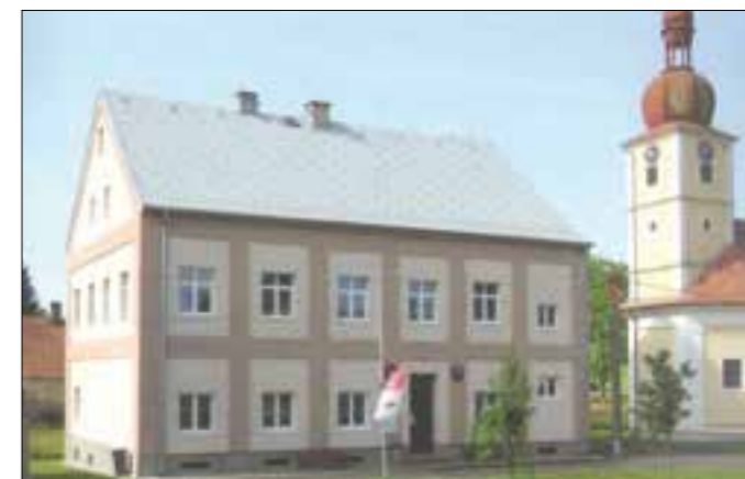
... a teď