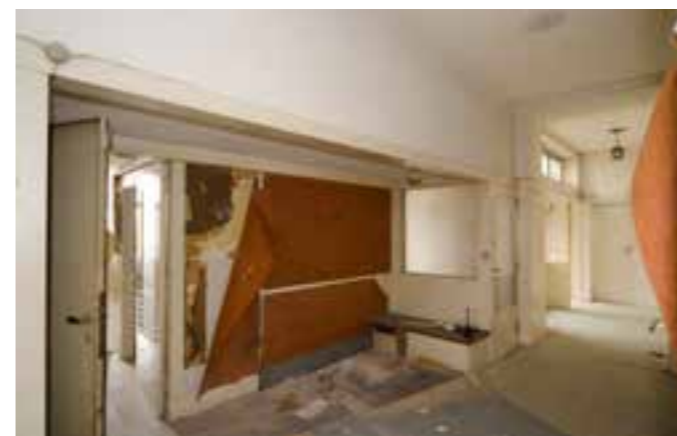
Soukromé patro rodiny před rekonstrukcí

Plzeňský kraj získal bytový dům na Klatovské třídě 110 v roce 2012 a předal jeho správu a dohled nad plánovanou rekonstrukcí Západočeské galerii v Plzni. Rekonstrukce objektu proběhla ve třech fázích. První začala již v roce 2013 a týkala se střech, izolace podkroví a suterénu a bylo také vybouráno několik novodobých konstrukcí. Druhá fáze započala v roce 2015 a týkala se oprav plochých