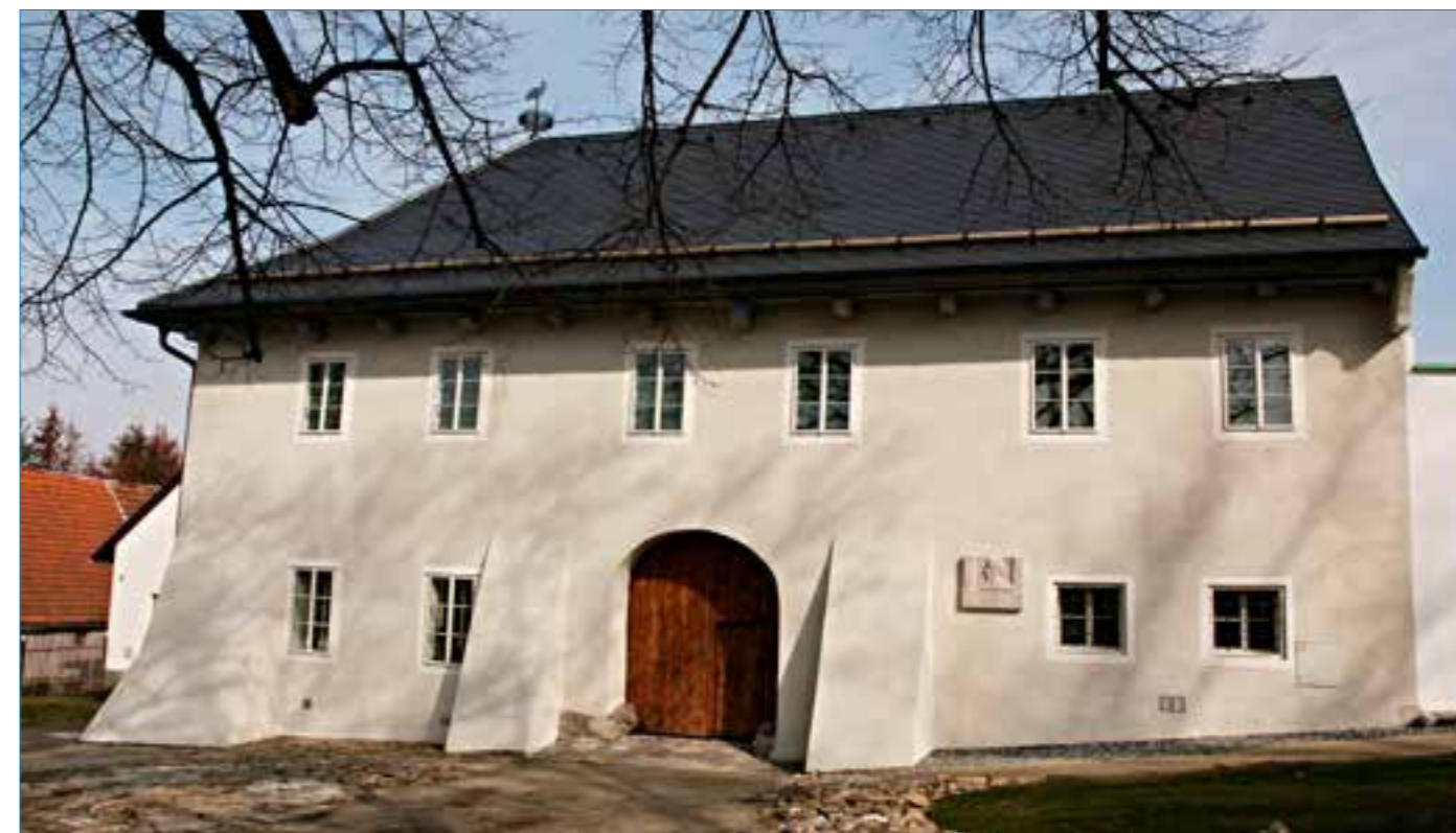
Stará pošta, dnes Dům přírody Českého lesa.