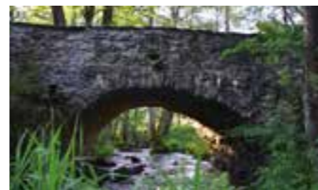
Historický kamenný most přes řeku Radbuzu – bývalý Mostek

Podobně jako Český les jsou na tom i Brdy, pro turismus dlouhé roky zapovězené kvůli svému vojenskému poslání. Na rozdíl od Šumavy, která byla přístupná i za socialismu a měla ubytovací i hostinskou infrastrukturu, Brdy nemají hotely, penziony, ale ani lidí se zkušenostmi s tímto byznysem. Nabízí se otázka: Je potřeba propagovat Šumavu, která je přeplněná lidmi a známá třeba díky oblíbenému televiznímu seriálu Policie Modrava? „My jsme měli sezení s představiteli šumavského